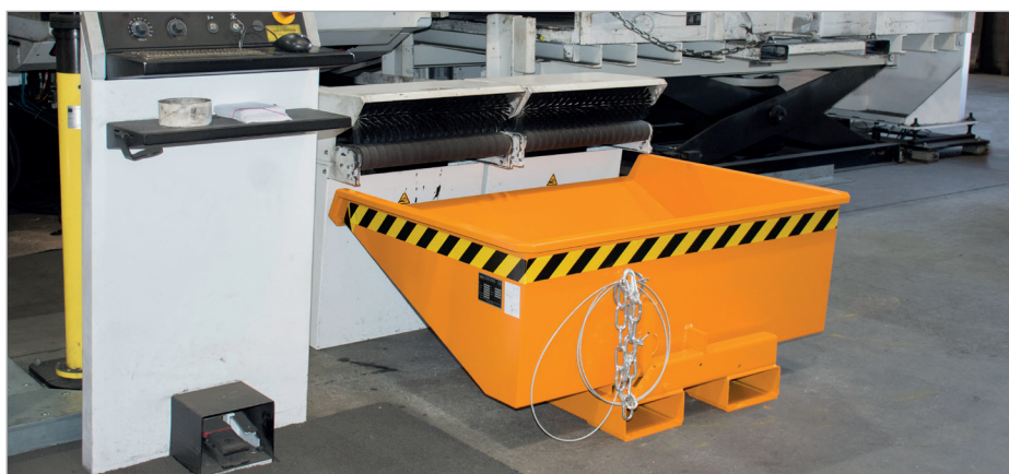
EXPO 150-275: Uitermate geschikt voor inzet onder machines vanwege de lage kiepwand van 455 mm hoogte