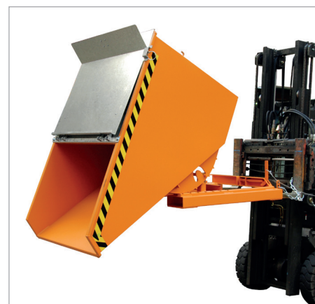
EXPO met deksel