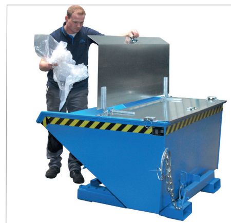
EXPO met deksel