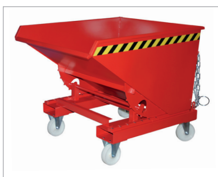
EXPO met wielen