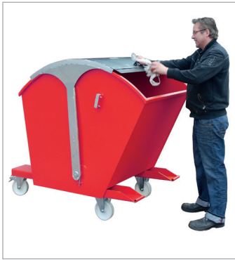
RD met wielen