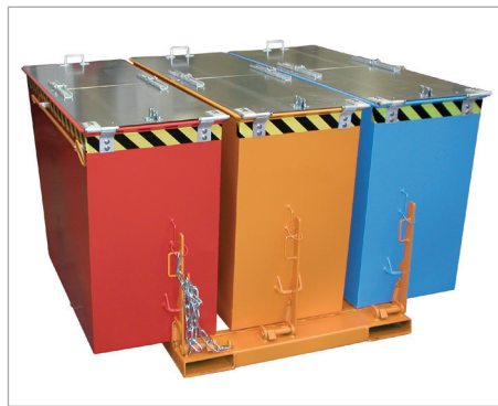
TRIO met deksel