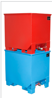
CS 30 stapelbaar