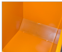
geperforeerde plaat (CS)