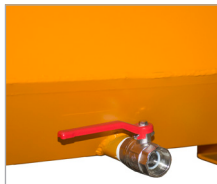
1" aftapkraan (CS)