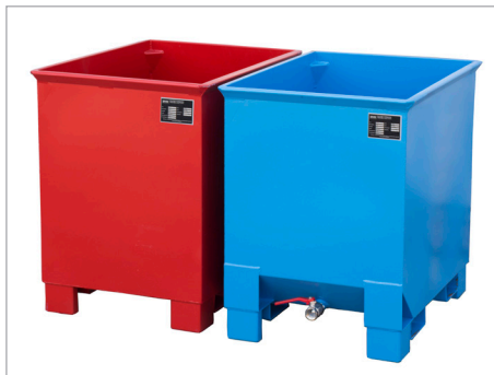
C 30 en CS 30