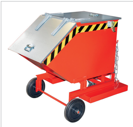
KW-ET met deksel